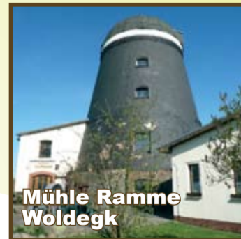
Mühle Ramme Woldegk