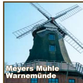
Meyers Mühle Warnemünde