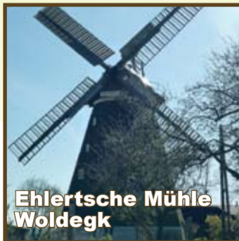
Ehlertsche Mühle Woldegk

Offiziell eröffnet wird der Deutsche Mühltentag in Mecklenburg-Vorpommern in der Wittenburger Mühle. Genauso herzlich laden alle anderen Mühlen zu einem Besuch. Nähere Informationen unter www.muehlenverein-m-v.de und/oder www.zwillingswindmuehlen.de . Informationen zu einer Mühle in der Nähe: