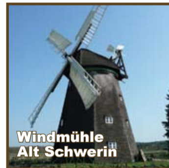
Windmühle Alt Schwerin