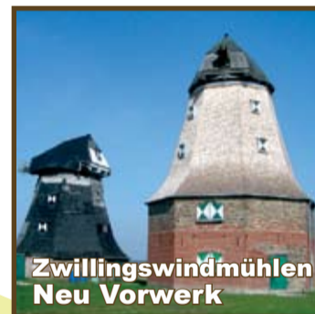
Zwillingwindmühlen Neu Vorwerk